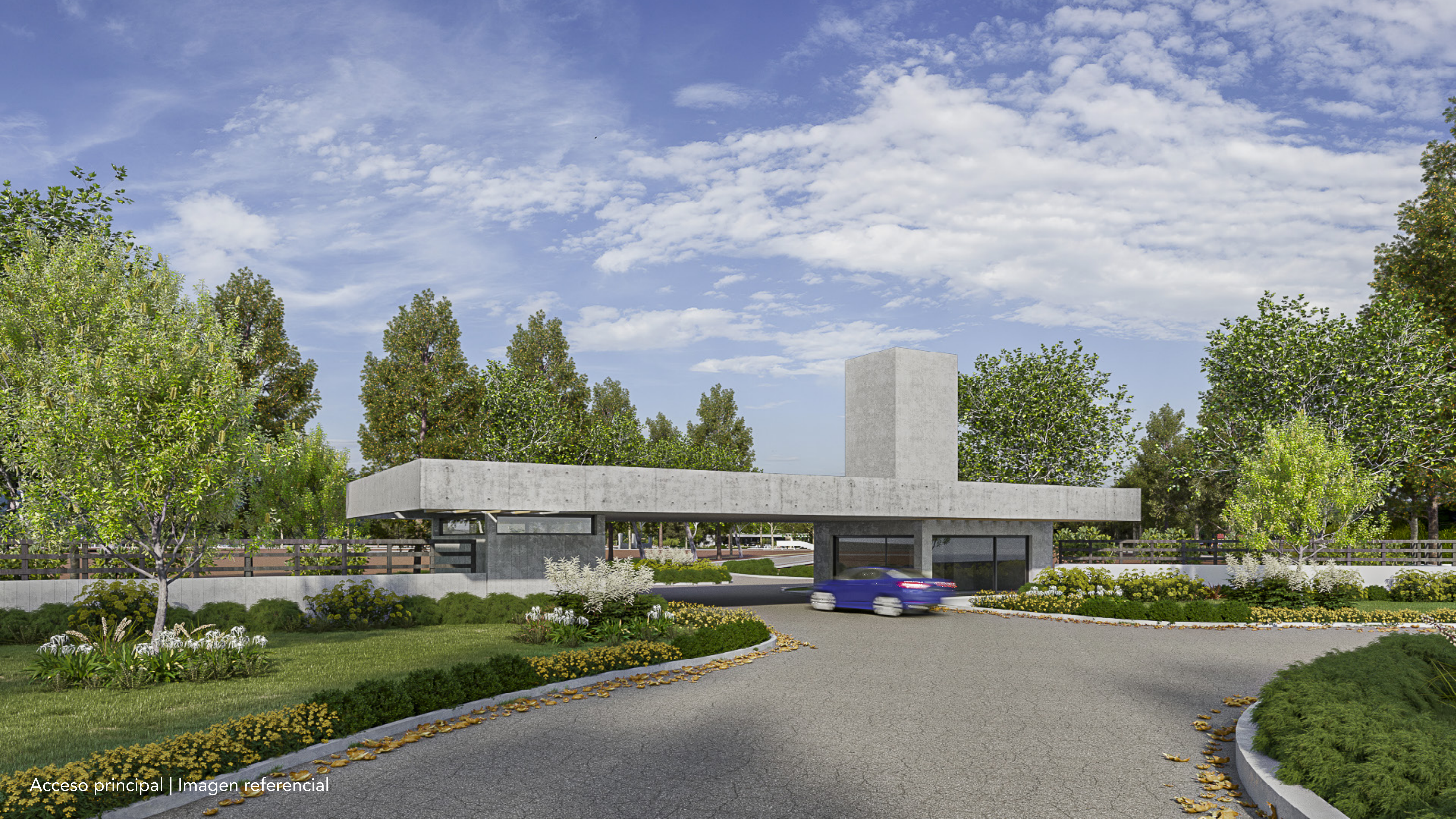
Acceso principal | Imagen referencial